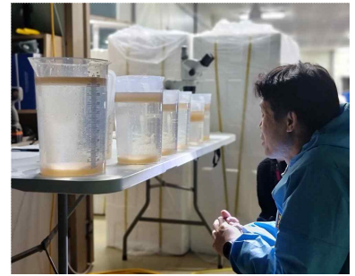
참조기·부세 수정란 생산 및 수거