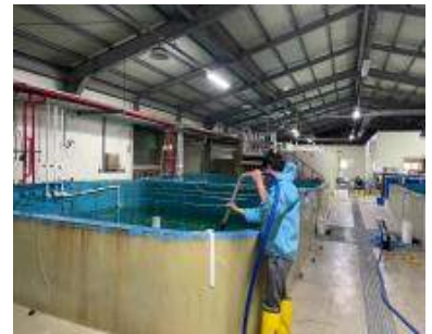
종자 양성을 위한 먹이생물 배양 및 수질관리