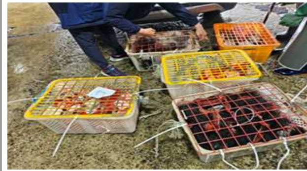
외포란 어미 꽃게 확보