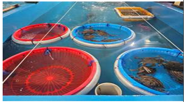
외포란 꽃게 성숙도별 선별