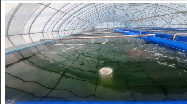
종자생산 수조 입식